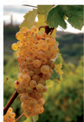
VERNACCIA DI SAN GIMIGNANO